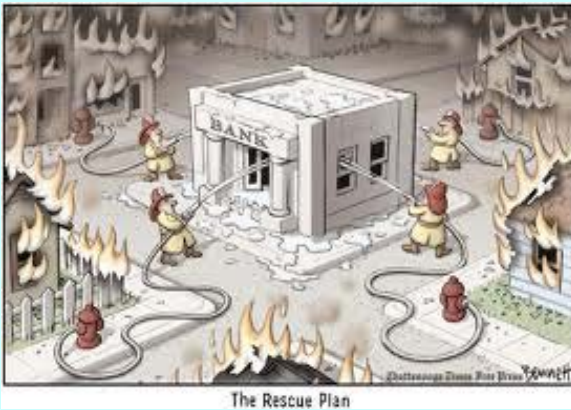
Plan de rescate

Queremos vivir en una sociedad más equitativa y no nos conformamos sumisamente a los recortes sociales que están imponiendo a los trabajadores y a las capas sociales más humildes. La subida brutal de la energía consentida por el gobierno sirve para engordar más aún los bolsillos de compañías eléctricas y del gas, agravando la situación, de por si ya muy precaria, de muchas familias. La subida del IVA, gasolina, tasas municipales, etc., están provocando una subida de los precios muy sensible en las economías familiares.