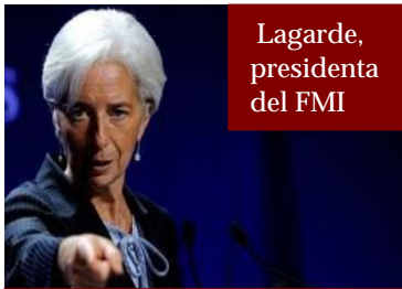
Lagarde, presidenta del FMI

Todo indica que estas diez entidades acumulan activos inmobiliarios calificados como tóxicos (miles de millones) y se necesita imperiosamente sanearlos. Funcionarios del FMI llevan haciendo revisiones periódicas en España para seguir el problema de cerca. Hasta ahora el Gobierno, en boca del ministro de Guindos, se niega a seguir la opción del FMI, pero ya veremos. Además de Bankia se señalan a Caja 3, Unnim, Duero, CAM y Cívica, que ya han sido absorbidas por otras entidades y que, por lo tanto, tienen en su poder esos activos tóxicos citados ¡Ay madre!