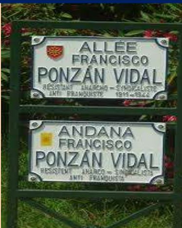
Calles dedicadas a Ponzán en Toulouse.