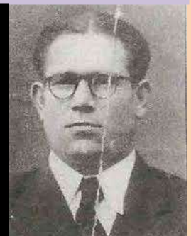
Caracterizado con gafas apareció en el Burgo de Ebro en Marzo del 40 para ver a su mujer e hijos.