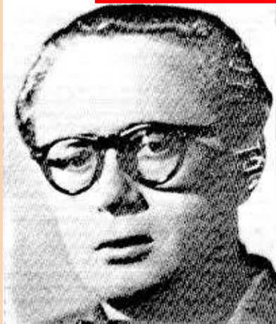
Francisco Ponzán Vidal, "Paco", "el gafotas", "el gurrión" o "el maestro de Huesca"