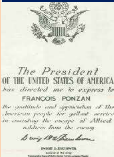
Certificado de gratitud de EEUU. Además fue distinguido por Su Majestad británica con la Hoja de Laurel y la Medalla por la Libertad. Capitán de las fuerzas francesas, Medalla de la Resistencia, Cruz de Guerra y reconocimiento y admiración de los aliados...