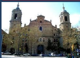
Santiago el Mayor de Zaragoza, inmatriculada en 1987