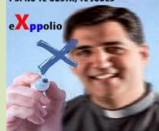
La IC ha considerado que todo lo inmatriculado hasta ahora, que no lo sabe nadie a pesar de estar pidiéndolo cada vez en más comunidades autónomas y ayuntamientos, le pertenecen desde tiempo inmemorial, que son de su "dominio", como La Seo, por ejemplo

PONEMOS TODO A NUESTRO NOMBRE Y SI NO TE GUSTA, TE JODES