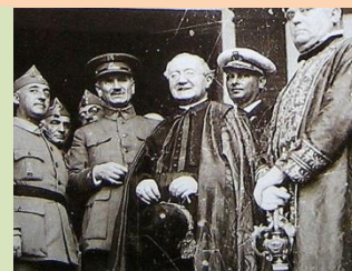
El régimen franquista favoreció y privilegió a la IC, su aliada en la "gloriosa cruzada" y tras la victoria militar hasta la muerte del dictador

En 1998 el gobierno popular de Aznar aprueba una reforma de la Ley Hipotecaria que permitió a la IC inmatricular también los lugares de culto, hasta entonces no se podía hacer legalmente. Se abrió el grifo para que se registrara a nombre de la IC las grandes catedrales y basílicas de todo el país. Recordamos que el registro se realizó sin necesitar otro requisito que el certificado del obispo y sin estar obligado a hacerlo público por edicto y sin pagar el impuesto pertinente de transmisión patrimonial. Aznar liberalizó el suelo, concedió y compensó a la IC con algo así como lo contrario a las desamortizaciones liberales del siglo XIX