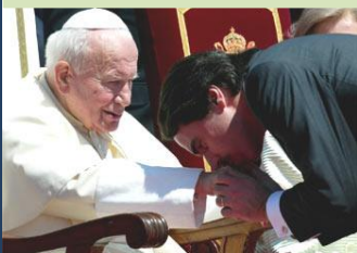
Aznar ante el Papa, postrado, un gesto ancestral en España, el poder civil se inclina ante la Iglesia

En la misma línea el Reglamento de la Ley Hipotecaria, aprobado por el Decreto de 14 de Febrero de 1947 , en su artículo 304: "En el caso de que el funcionario a cuyo cargo estuviese la administración o custodia de los bienes no ejerza autoridad pública ni tenga facultad para certificar, se expedirá la certificación a que se refiere el artículo anterior por el inmediato superior jerárquico que pueda hacerlo, tomando para ello los datos y noticias oficiales que sean indispensables. Tratándose de bienes de la Iglesia, las certificaciones serán expedidas por los Diocesanos respectivos".