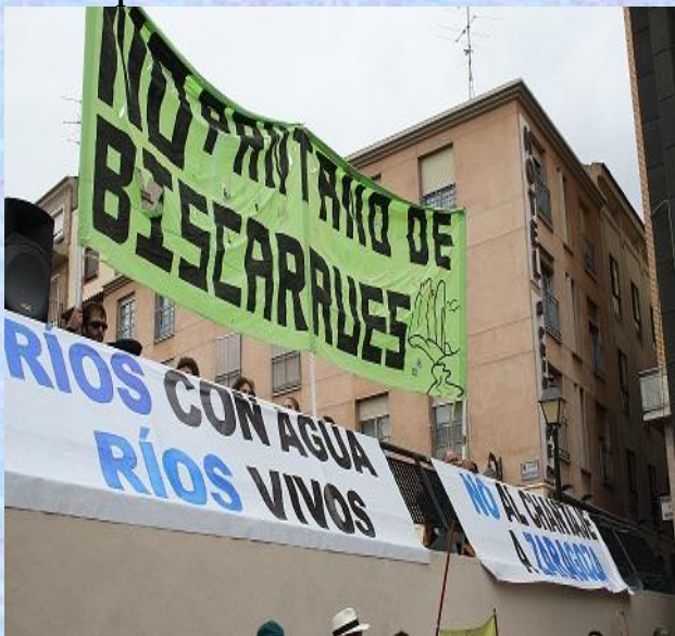
Una de tantas manifestaciones

Cada vez que uno o varios pueblos aragoneses son amenazados por la construcción de una gran presa se nos encoje el corazón, más aún si se da la circunstancia de que tienen futuro en base a actividades económicas sostenibles como es el caso de Biscarrués. Es un proyecto que cuenta con más de 20 años ya de incesante polémica. La Confederación Hidrográfica y Gobierno de Aragón, insisten en que es una obra de "interés general" y además presionan al gobierno español para que se ejecute; Riegos del Alto Aragón lo exigen para regar más hectáreas; los afectados se niegan en redondo a que sus pueblos sean pasto del olvido y del abandono... Por último hay expertos que aseguran existen alternativas.