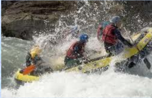
Rafting en la Galliguera

Sin embargo, la inercia ideológica e intereses electorales de los partidos políticos del gobierno de Aragón (PSOE-PAR) han provocado que estén realizando presiones políticas sobre el ministerio de medio ambiente para desestimar ese estudio y las prescripciones técnicas que en él se contienen. La ministra de medio ambiente, Rosa Aguilar, ha cedido a esas presiones realizando declaraciones a favor de la continuidad del proyecto. (E. A.)