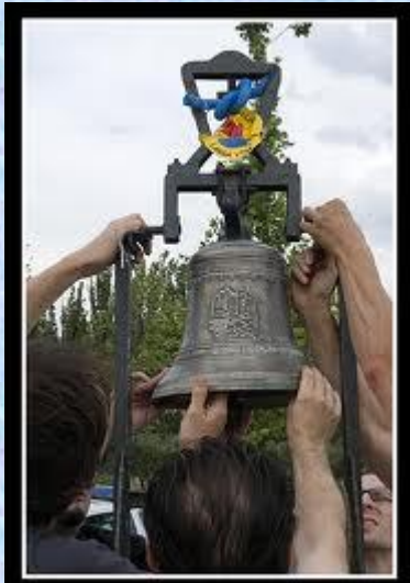
La Campana de Biscarrués

Cada vez que uno o varios pueblos aragoneses son amenazados por la construcción de una gran presa se nos encoje el corazón, más aún si se da la circunstancia de que tienen futuro en base a actividades económicas sostenibles como es el caso de Biscarrués. Es un proyecto que cuenta con más de 20 años ya de incesante polémica. La Confederación Hidrográfica y Gobierno de Aragón, insisten en que es una obra de "interés general" y además presionan al gobierno español para que se ejecute; Riegos del Alto Aragón lo exigen para regar más hectáreas; los afectados se niegan en redondo a que sus pueblos sean pasto del olvido y del abandono... Por último hay expertos que aseguran existen alternativas.