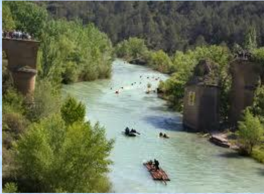
Vistas del Gallego