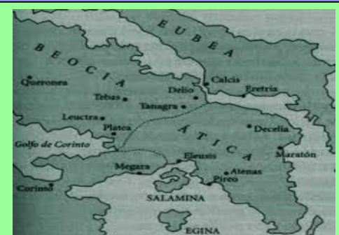
Ática en el siglo V a.C.

En aquella época Grecia estaba salpicada de Polis, cuyo esquema se reducía a un territorio más o menos extenso dominado por una ciudad (Territorio Ática y Polis, Atenas). Existían tres modelos políticos: la Oligarquía , donde una minoría aristocrática detentaba el poder; la Gerontocracia , consejo de ancianos (Esparta) y la Democracia , cuyo primer caso es el de Quios que establece instituciones democráticas en el 560 a. C.