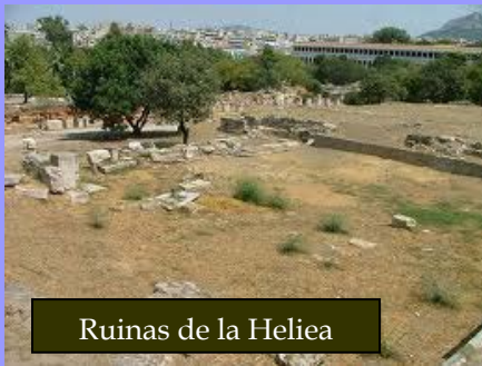
Ruinas de la Heliea

Se mantienen casi igual el Areópago y la Heliea (tribunal de apelación). En los tribunales participaban 6000 ciudadanos (heliastas) de más de 30 años elegidos por sorteo, algo más de 500 por tribu. La división en 10 tribus se reflejó también en la estructura del ejército a cuyo frente se nombran 10 Stratego i o estrategas y con control del arconte polemarco (uno de los 9 tradicionales). Los stratego i eran elegidos en la Asamblea entre los miembros de las dos primeras clases solonianas y podían ser reelegidos.