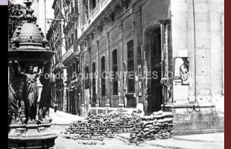
Barricada en la Ronda de Santa Mónica