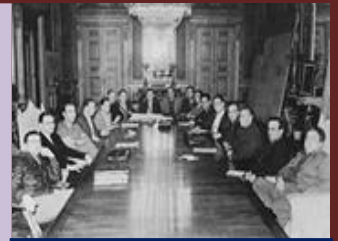
Comité de Milicias Antifascistas, órgano revolucionario y verdadero gobierno en Cataluña hasta Octubre del 36