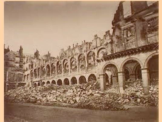
Palacio de las fianzas, demolido

En palabras de Max Nettlau , llamado el Herodoto del anarquismo , recogidas en su obra "El anarquismo a través de los tiempos", la Comuna fue el producto de la concurrencia de múltiples factores lo que le valió una interpretación en favor de ideas muy variadas y no sólo liberales y libertarias. Por sí misma, obstaculizada y llevada al autoritarismo por su situación de defensa desesperada contra feroces enemigos que la ahogaron en sangre, la Comuna fue un microcosmos autoritario, lleno de pasiones de partido, de funcionarismo y de militarismo, hecho que su fin heroico en la muerte pasó a menudo al margen de la crítica de los libertarios. En esta misma obra se recogen las opiniones de un viejo militante comunista de la revolución de 1848, Gustave Lafrancais , quien afirmaba que "el antiestatismo era perfecto, pero en el interior de la Comuna preconizada había restos indelebles de gubernamentalismo municipal, local y una desconfianza hacia la anarquía"... Fue el primer intento de la clase trabajadora de hacerse con el poder, de cambiar el estado de las cosas con la aspiración puesta, y será una constante en las reivindicaciones tanto de marxistas como de libertarios: libertad, igualdad y justicia social .