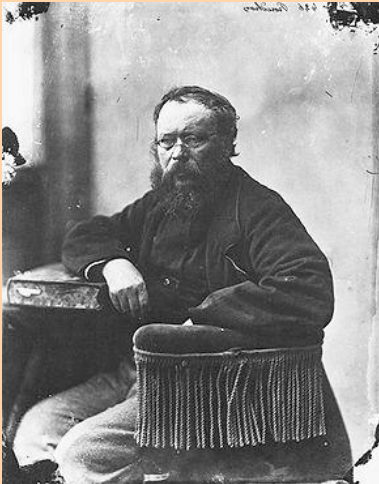
Pierre Joseph Proudhon