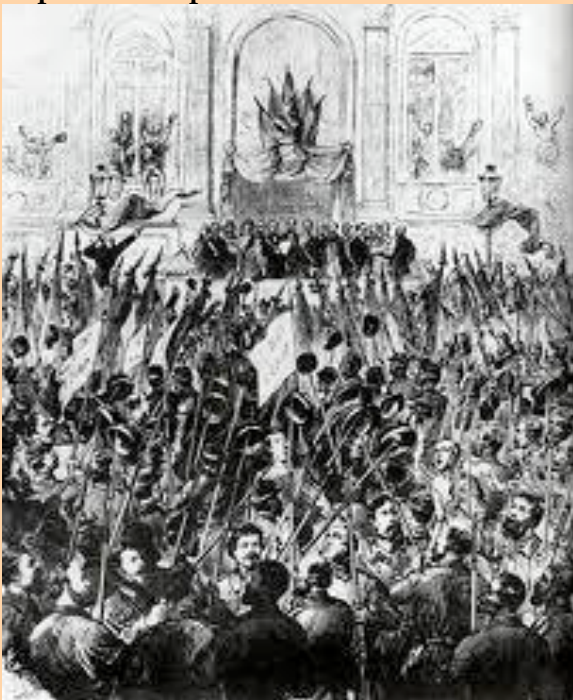
Proclamación de la Comuna

Mientras tanto se celebran unas elecciones en el país y se forma un nuevo gobierno, que se establece en Versalles , a cuya cabeza se pone a Thiers , quien se enfrenta con la difícil papeleta de negociar el tratado de paz con Prusia , indemnizaciones de guerra y, entre otros asuntos, la devolución al Reich de Alsacia y Lorena (con población de habla alemana). El arreglo del entuerto necesitaba dinero para pagar a los alemanes pues si no se quedarían en suelo francés. Subieron los impuestos y adoptaron medidas gravosas para la clase humilde, cuestión que no alegró precisamente los ánimos. Pero quedaba un hueso complicado de roer, la Guardia Nacional seguía armada y con unos doscientos cañones. Thiers decide mandar tropas y apoderarse de la artillería. En el primer momento todo va bien, el plan consistía en llegar de noche y hacerlo con rapidez, pero la mañana llegó sin haber terminado la operación y los parisinos, que no estaban para nada de acuerdo con las medidas tomadas por el nuevo gobierno ni con las condiciones negociadas con los alemanes, se sublevaron espontáneamente.