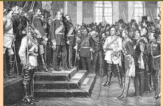
Guillermo I en Versalles 1871

Al frente del gobierno prusiano se encontraba un hombre de grandes dotes organizativas y diplomáticas, de mano férrea, era Bismarck , "el canciller de hierro". Desde los inicios de la contienda el ejército francés fue batido en todos los frentes. Los alemanes al mando de Moltke sitian a los franceses en Metz , el 1 de Septiembre los vencen con estrépito en Sedán donde capitula el general Mac Mahon , y para rematar capturan al emperador fulminando la nueva etapa imperial francesa. El 18 de Enero de 1871, se proclama Keiser en la sala de los espejos de Versalles a Guillermo I de Prusia .