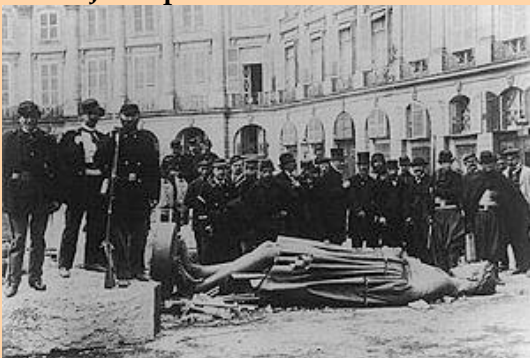
Dstrucción columna Vendome

La Comuna se compuso por 81 miembros, que salieron de los veinte distritos en que se dividía la ciudad, eran consejeros municipales, la figura que más se les acerca hoy sería la de concejal.