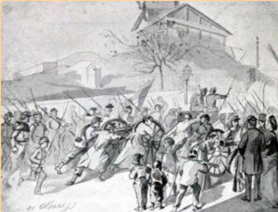
El pueblo se apodera de los cañones