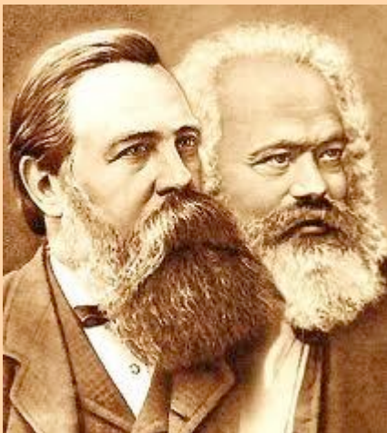
Engels y Karl Marx

La paradoja estaba en que Francia había sido vencida pero París no, quien en vista de que está sola frente al ejército invasor se prepara para continuar la guerra y, además, proclama la III República . Se permite a los diputados parisinos, que formaban parte del anterior cuerpo legislativo, constituirse en Gobierno de Defensa Nacional y, como era de esperar debido a su origen, la mayoría burgueses y aristócratas, siguieron en la misma línea. El pueblo de París fue armado para la defensa, los alemanes sitian la ciudad durante 131 días, pero no se deciden a entrar. La Guardia Nacional era la única fuerza armada parisina, todos los hombres capaces de empuñar las armas se enrolan en ella, la mayoría son obreros o pequeños artesanos, alguno de ellos con mentalidad revolucionaria gracias a las ideas socialistas de la AIT y también del anarquista Proudhon . Este último murió unos años antes de surgir el estallido revolucionario.