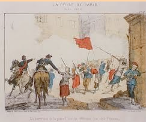
La Guardia Nacional con el Pueblo

Lo mismo Prusia que amenaza con lanzar a las tropas alemanas allí estacionadas si el asedio se retrasa. Otro sector preocupado con el asunto y deseoso de llegar al final por las malas influencias que pudiera ocasionar es la burguesía europea en general. Al día siguiente de la proclamación de la Comuna , el London Times describe la revolución como: “predominio del proletariado sobre las clases pudientes, del artesano sobre el oficial, del Trabajo sobre el Capital”.