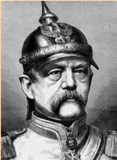
Otto von Bismarck El Canciller de Hierro