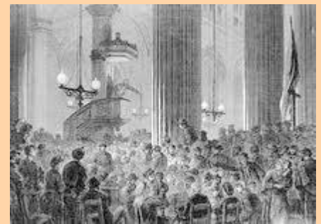
Sesión de la Comuna

Mientras los federados se afanaban en defender la ciudad y en ir para adelante con su revolución, considerada posteriormente por algunos como reformista, los de Versalles no daban tregua alguna. Thiers negoció con los alemanes la devolución de los prisioneros de guerra lo cual hizo que sus tropas fueran aumentando gradualmente y así incrementó la presión sobre la ciudad. Conforme pasaban los días la Comuna iba acumulando nuevos enemigos, el zar de Rusia pide al gobierno francés que actúe con más celeridad.