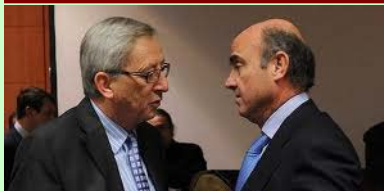
De Guindos anticipa la agresiva Reforma en Europa

Desde que se aupó al gobierno el PP está provocando un retroceso social inasumible para cualquier ciudadano con un mínimo de sentido común. Todo empieza por dichoso déficit y sigue con unas medidas anti sociales que argumentan necesarias para superar la crisis (para nosotros estafa). El elefante se pone en marcha y ya puestos mejor que entre con desenfreno en la cacharrería: Justicia, aborto, educación, sanidad, cultura, nucleares, economía, relaciones laborales, salarios, etc. Antes de las elecciones sostenían lo contrario, han mentido con el sólo propósito de alcanzar el poder. Debe ser un placer orgásmico eso de tener y ejercer el poder. Es patético ver la actitud de colegial pelotas diciéndole al colega extranjero lo bien que van a meternos en vereda. Sin duda esperarán esa palmadita en la espalda y el celebre: "¡Bien chaval, bien. Aprobado!". Da repelus, por no decir asco, la sumisión que transmiten.