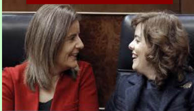
Las ministras también se ríen, aseguran que es por el bien de los 5M de parados.