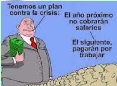
La patronal se ríe.