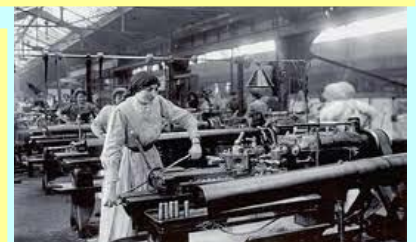
Las mujeres trabajaban en unas condiciones lamentables

Vito Gianotti en un trabajo sobre los orígenes del Día Internacional de la Mujer y a propósito de la Huelga del 8 de Marzo de 1857, hace un interesante repaso de fechas y acontecimientos... La primera mención a este hecho aparece en L'Humanité, periódico del Partido Comunista Francés (7 de Marzo de 1955) y no habla de mujeres fallecidas. Pero donde se relaciona la citada huelga con el 8 de Marzo es en un boletín, editado en 1966 en Berlín Oriental, de la Federación Internacional Democrática de las Mujeres (Alemania Oriental), donde además se habla de las mujeres quemadas y se dice que, en su recuerdo, Clara Eissner (Zetkin) propuso en Copenhague la fecha del 8 de Marzo como Día Internacional de la Mujer... La historia ficticia probablemente tuvo su origen en dos huelgas ocurridas en Nueva York pero en diferente época. La primera fue una larga huelga de modistas que duró desde el 22 de Noviembre de 1909 hasta 15 de Febrero de 1910. La segunda fue la del 29 de Marzo de 1911 a cauda de la muerte de 146 trabajadores, la mayoría mujeres inmigrantes judías e italianas, atrapadas en el octavo piso, por las pésimas instalaciones de una fábrica textil. Este suceso apareció publicado por la prensa socialista americana como un crimen cometido por los patronos, por el capitalismo.