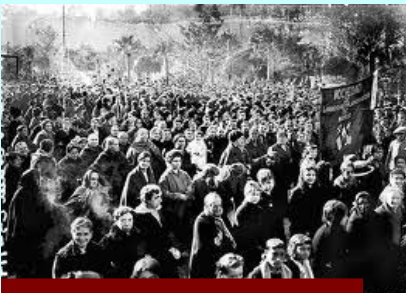
Trabajadoras de la Cotton