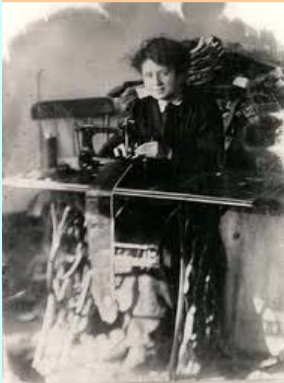
El sector textil en EEUU era muy importante,