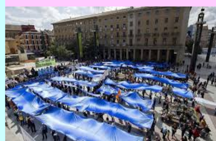
Manifestación en defensa de la gestión pública del agua de Zaragoza.

Llama la atención que en la anterior legislatura gobernó el partido socialista de Bachelet (:?)